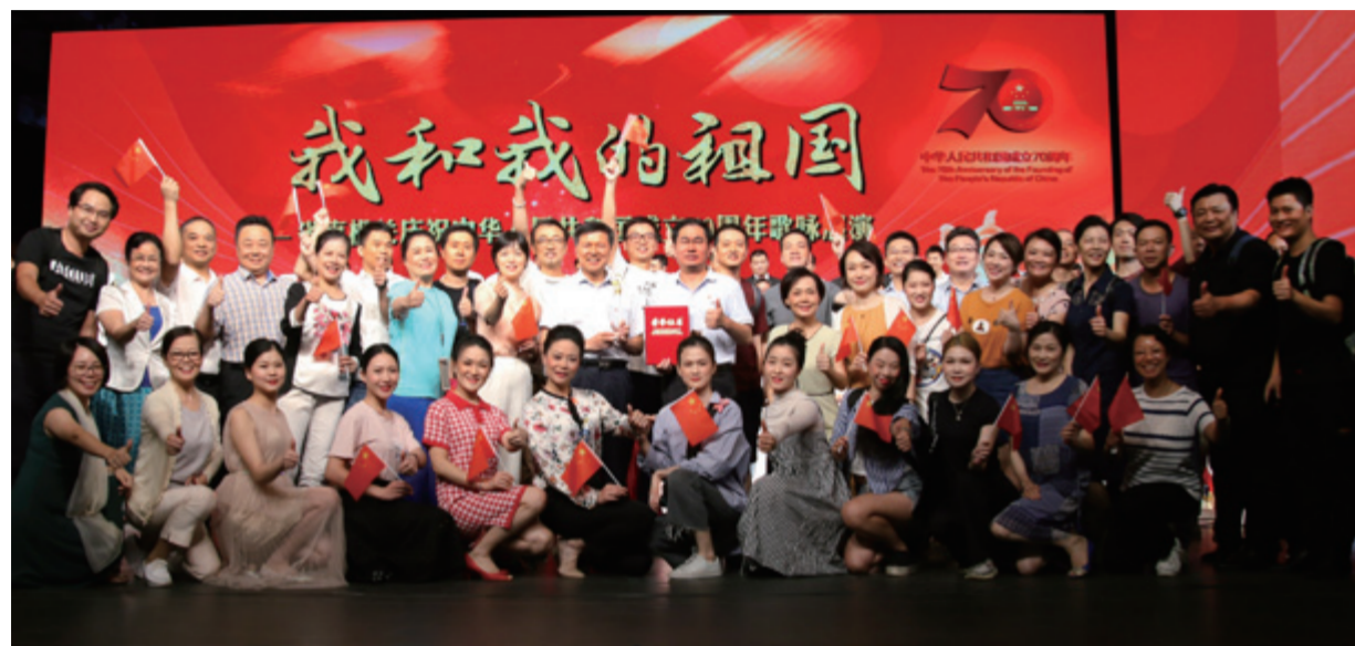
为隆重庆祝中华人民共和国成立70周年，热情讴歌党、讴歌祖国、讴歌人民，真情赞美祖国取得的伟大成就，唱响“礼赞新中国 奋进新时代”主旋律，省直机关于9月25日下午在省粤剧院隆重举办了“我和我的祖国”歌咏展演活动。我

院合唱团代表省卫健委以一曲《龙的传人》力压群芳，夺得本次大赛一等奖，充分展现了卫生健康系统医务工作者昂扬向上的精神风貌，他们用嘹亮的歌声唱出对祖国的深情热爱，唱出对美好明天的向往，为省医再添荣誉！