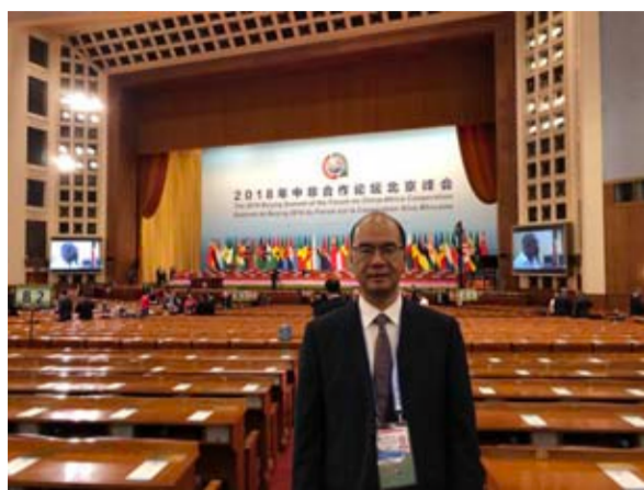
初秋是北京，金风送爽，秋色宜人。9月3日，中非合作论坛北京峰会在人民大会堂隆重开幕。中国国家主席习

近平出席开幕式并发表题为《携手共命运，同心促发展》的主旨讲话。峰会由国务委员、外交部长王毅主持。论坛共同主席国南非总统拉马福萨，非洲联盟轮值主席卢旺达总统卡加梅，特邀嘉宾联合国秘书长古特雷斯，非洲联盟委员会主席法基分别致辞。出席峰会的中非各届人士约3200人，其中，中国援非医疗队代表共47人。我院郑江华医生是援加纳医疗队的唯一代表，他是第5批中国援加纳医疗队队长兼党支部书记。